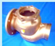
鉛フリー銅合金 滋賀バルブ協同組合・彦根市

センターの技術シーズを皆様の課題解決に活用いただけます。共同研究では、専門の職員が事業化まで伴走し、サポートします。