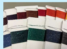
水を使わない染色 (株)フジックス・東近江市