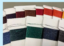
水を使わない染色 (株)フジックス・東近江市