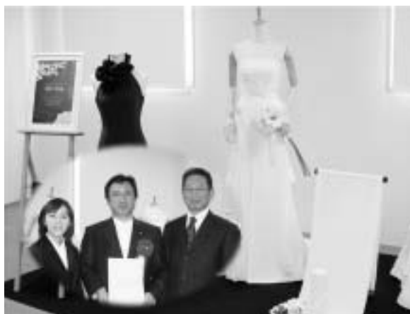
地域資源活用事業計画認定書交付式（滋賀県）

事業概要 ：和装の生地として最高級の品質を誇る「浜ちりめん」を、質感・風合いを活かせるウェディングドレス、パーティードレスへの展開をはかり、“ジャパニーズシルク洋装用素材”としての商品開発を行う。また、デザイナーと連携し、販路開拓を進める。