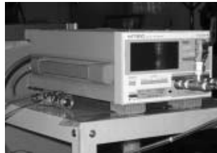
デジタル圧力計（差圧モデル）