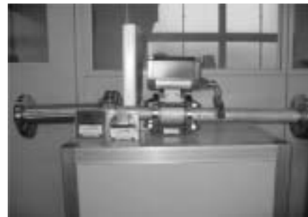
電磁流量計アセンブリ