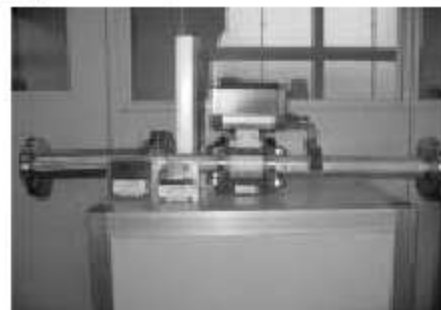
電磁流量計アセンブリ