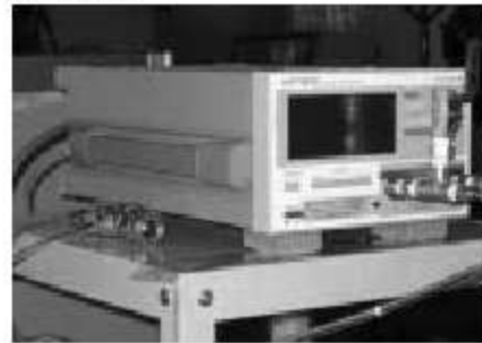
デジタル圧力計（差圧モデル）