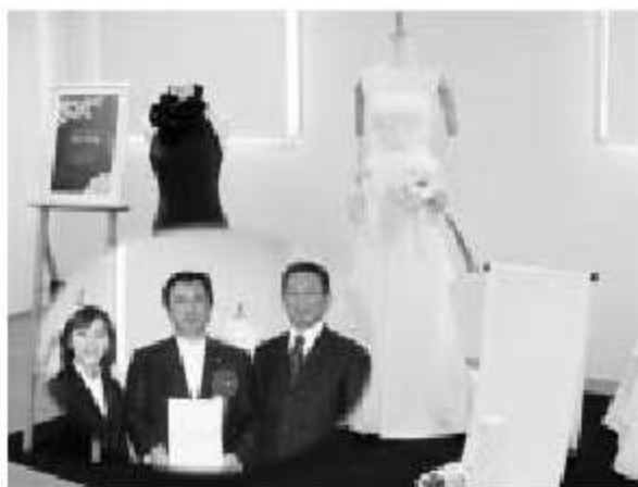
地域資源活用事業計画認定書交付式（滋賀県）

事業概要 ：和装の生地として最高級の品質を誇る「浜ちりめん」を、質感・風合いを活かせるウェディングドレス、パーティードレスへの展開をはかり、“ジャパニーズシルク洋装用素材”としての商品開発を行う。また、デザイナーと連携し、販路開拓を進める。